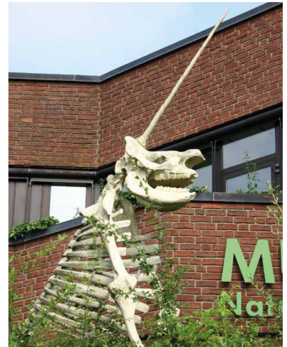
Abb. 5: Dreidimensionale Rekonstruktion des »Quedlinburger Einhorns« nach der Beschreibung von Guericke's und den Zeichnungen bei Leibniz und Valentini, 1998, vor dem Museum am Schölerberg in Osnabrück.

Eine plausible Erklärung bot zu dieser Zeit die biblische Sintflut-Geschichte: Einer alten ostjüdischen Legende zufolge war das Einhorn nämlich umgekommen, da es für Noahs Arche zu groß und zu wild gewesen war (Kat. 2.11). 35 Auch für Leibniz, der fortschrittlichen Theorien mit großem Interesse begegnete, stellten die biblischen Schilderungen, »von denen abzuweichen sündhaft ist«, 36 weiterhin eine Autorität dar. Vor diesem Hintergrund verwundert es wenig, dass sich alternative Deutungen noch nicht durchsetzen konnten.