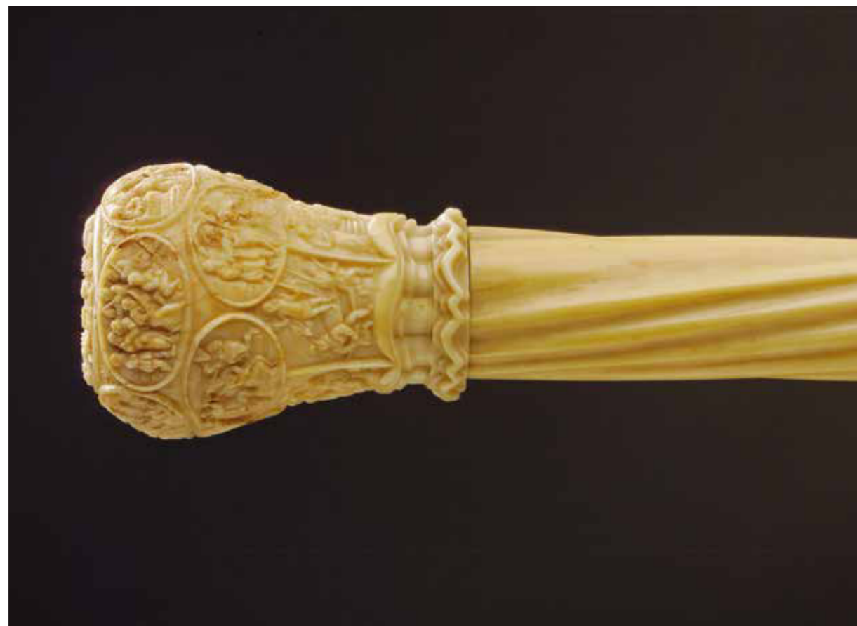
Abb. 2: Spazierstock aus Narwalzahn mit Szenen aus dem Leben Christi, 1675–1678, heute im Hessischen Landesmuseum Darmstadt, Foto: Wolfgang Fuhrmannek.

Abb. 3: Zwei gestrandete Narwale, nachkolorierte Zeichnung von James Hope Stewart und William Home Lizars, 1837. Der Narwal im Vordergrund hat sogar zwei Stoßzähne – eine Seltenheit!