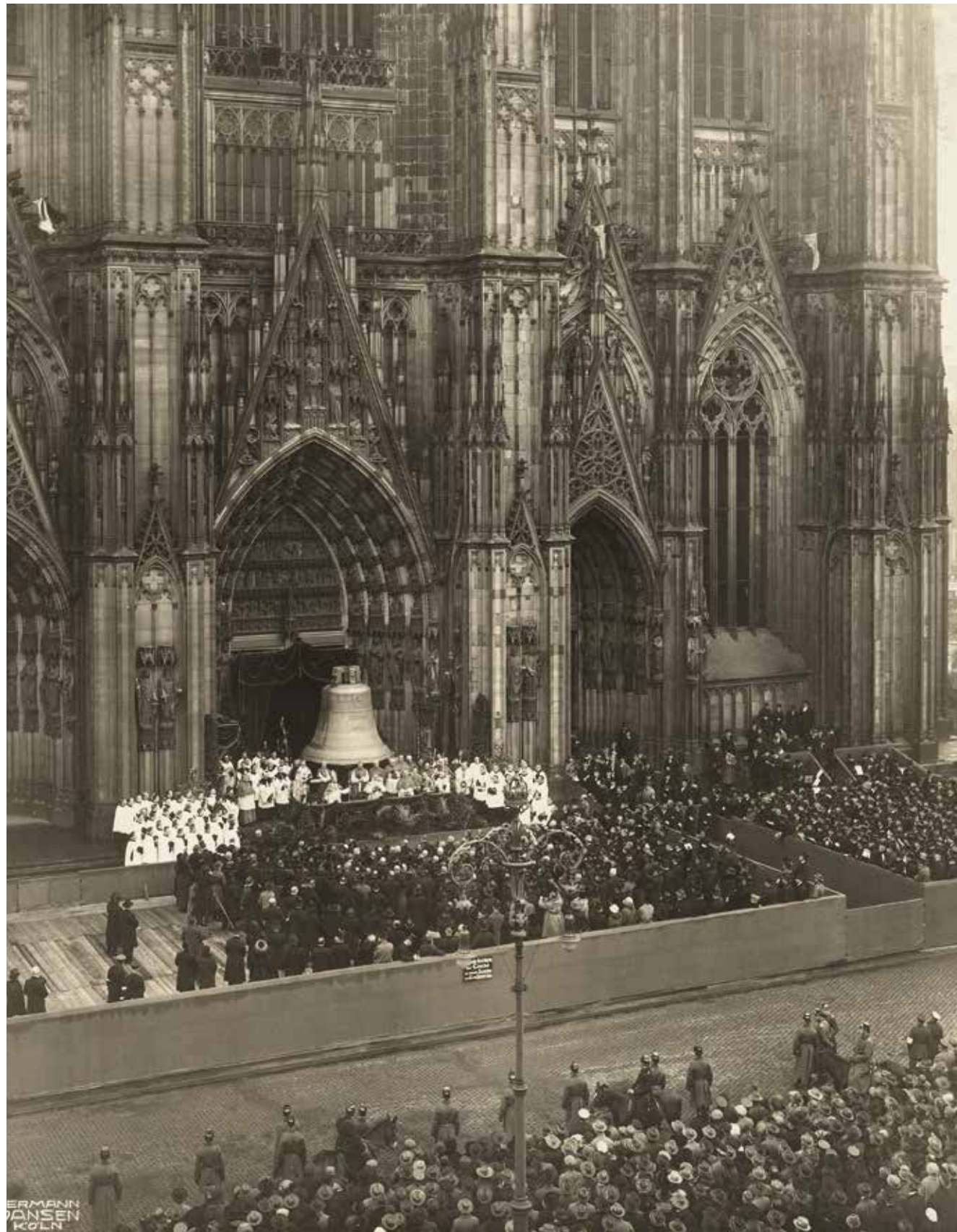
Feierliche Weihe der St. Petersglocke vor dem Hauptportal des Kölner Domes am 30. November 1924