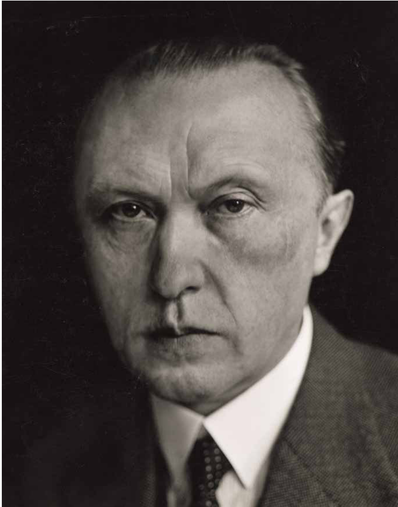
Konrad Adenauer