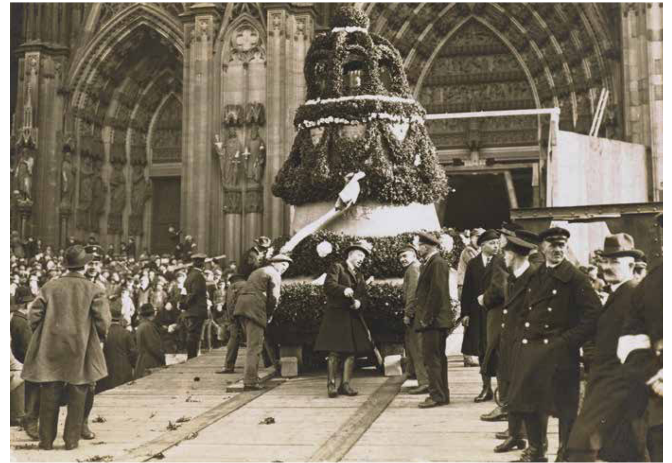
Empfang der geschmückten Glocke vor dem Kölner Dom am 24. November 1924

Schlagzeilen. „Du sollst uns treuste Freundin sein, / Mit jedem Glockenschlage! / Umjubelt ziehst du ein, / Du deutsche Glocke an den Rhein – / Verkünderin besserer Tage!“ 5 lautete es in der „Kölner Illustrierte Woche“. Zunächst wurde sie im Mittelportal aufgestellt und dort am 30. November von Erzbischof Karl Joseph Kardinal Schulte feierlich geweiht. Unter den zahlreichen Ehrengästen war auch Oberbürgermeister Konrad Adenauer. In seiner Ansprache würdigte Schulte die Geschichte und den Stellenwert der neuen Petersglocke: Diese solle „Sinnbild werden [...] von des deutschen Volkes und des Deutschen Reiches Einheit und zugleich Symbol des langersehnten endlichen Friedens und der Völkerversöhnung!“ 6