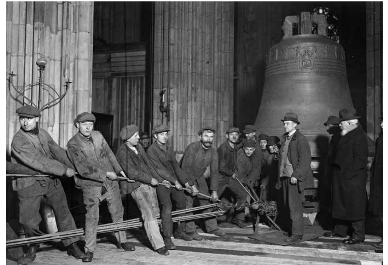
Mit Manneskraft wird der „Dicke Pitter“ in den Kölner Dom gezogen; Fotografie, 1924