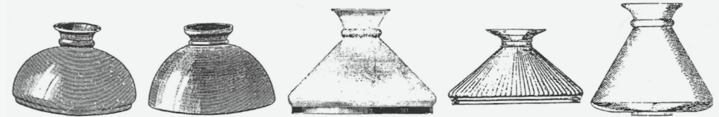
Petroleum-Lampenschirme, konventionelle Form, Vestaschirm, Dom, Rochester, kanneliert, Pariser Glocke

Augenschützer vertrat, wenn es diese Lobby denn damals schon gegeben haben sollte. Jedenfalls vertritt er die damals schon gültige Meinung, die zur Volksmeinung geworden war und sich über lange Jahre gehalten hat, wenn auch von medizinischer Seite immer darauf hingewiesen wurde, dass Lesen bei schlechter Beleuchtung zur Kurzsichtigkeit führe und nicht das helle Licht, was mittlerweile bestätigt ist. Es ist sicher so, dass unsere Vorfahren, die ihre langen Winterabende bei etwa 1/100 der Lichtstärke verbringen mussten, die uns heute im Schnitt zur Verfügung steht, eine ganz andere Sensibilität besaßen, was das Hell-Dunkel-Sehen betraf, wie schon mehrfach erwähnt. Der schon mehrfach genannte Graf Rumford behauptet, dass der Mensch zu seinerzeit in der Lage gewesen sei, Druckschrift von mittlerer Größe sowohl beim Licht des Vollmonds als auch beim Sonnenlicht am Mittag lesen zu können, was einem Verhältnis von 1 : 300.000 entspräche.