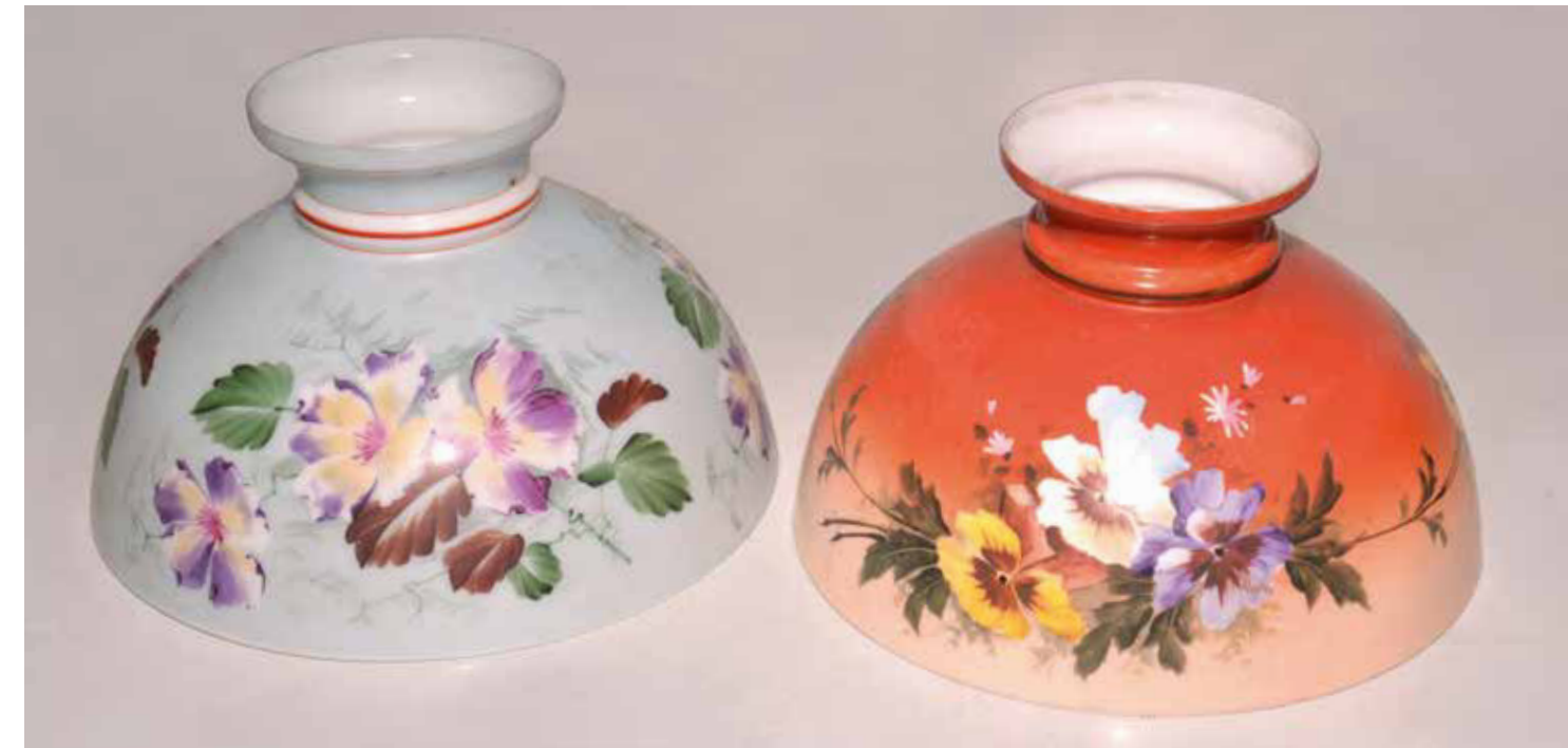
Handgemalte Lichtschirme, Deutschland, nach 1900

Die alltäglichen Schirmgrößen für Zimmerlampen lagen in der Regel bei 15,5 cm, 19,5 cm und 23,5 cm Durchmesser, wobei es natürlich auch 17,5 cm- und 18 cm-Schirme gab. Je nach Brennergröße wurde zur Bekrönung ein bestimmter Schirmdurchmesser empfohlen, so der 15er Schirm zum 8''', der 19er Schirm