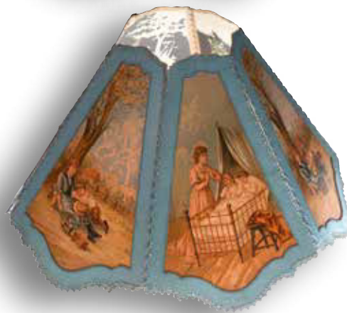
Lampenschirme aus Papier