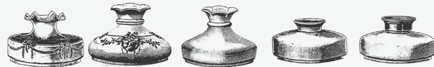
Jugendstil- und Art Deco Formen

Wenn das Licht der Petroleumlampe für den damaligen Menschen als zu hell erschien und man versuchte, eine leichte Blendwirkung durch Streuung des Lichtes mit Hilfe von Schirmen und Kugeln zu mindern, so war das abgestrahlte Spektrum der Lichtstrahlung doch recht augenfreundlich, es lag vor allem im gelb-orange-roten Bereich und deutlich weniger im blau-grünen Spektrum. Da die Makula-Lutea, die Stelle des schärfsten Sehens in der Retina des Auges, vorwiegend Rezeptoren für grünes und rotes Licht enthält, wirkt blaue Strahlung deutlich negativ für scharfes Sehen, vor allem wenn man noch die chromatische Aberration berücksichtigt.