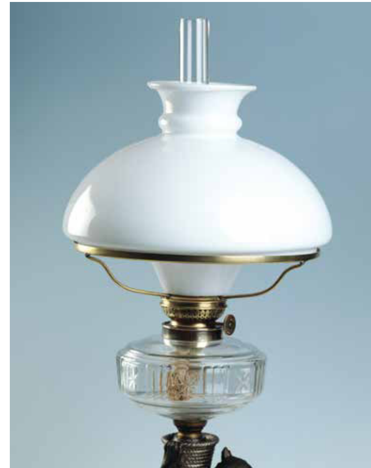
Augenschützer in Anwendung mit Milchglasschirm

Wenn bei der für uns heute recht mageren Ölbeleuchtung damals schon solche Bedenken und Ängste laut wurden, konnte es nach der Einführung der deutlich helleren Petroleumbeleuchtung nur schlimmer werden. Und das war auch so! Hören wir zu diesem Problem einen Autor, der im Jahre 1876, also etwa 15 Jahre nach Einführung der Petroleumlampe die Gefährlichkeit der Petroleumlampe so beschrieb: