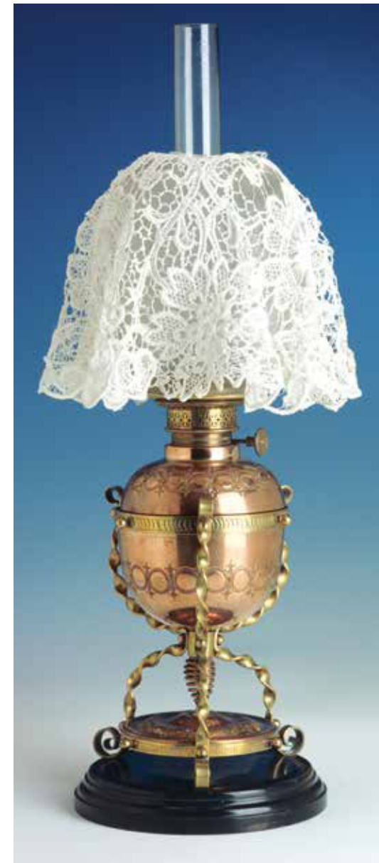
Lichtschleier aus Spitze, über der Kugel einer Tischlampe, mäßige Lichtdämpfung

Eine Besonderheit waren auch damals schon die Porzellanschirme in Lithophanietechnik, von denen nur wenige Exemplare erhalten geblieben sind, sodass sie heute als gesuchte Sammlerstücke zu hohen Preisen gehandelt werden. Bei der Lithophanie handelt es sich um ein in eine dünne Porzellanplatte eingepprägtes Tiefrelief. Die unterschiedliche Dicke des Porzellans lässt es unterschiedlich transparent erscheinen. Es entsteht ein gut abgestuftes Durchsichtsbild, häufig in Form von Genre-Szenen nach Gemälden alter Meister. Die Lithophanie soll 1827 durch Baron de Bourgoing erfunden worden sein und wurde anfangs als Lichtschirm, Fensterbild und Augenschützer, später als Lampenschirm eingesetzt. In den letzten Jahren ist die Lithophanie wieder modern geworden. Sie wurde in großem Maße von der Manufaktur Schierholz in Plau in den Handel gebracht.