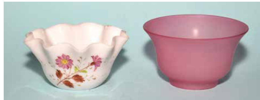
Augenschützer für das Auge annehmbare Farbe

„Leider lässt aber jeder Besitzer guter Augen das köstlichste Gut und wichtigste Glied am ganzen Körper, denselben nicht die genaue Behandlung zu kommen, die denselben in erster Reihe gebührt, und in welcher frivoler Weise wird mitunter an dem Augenpaar gesündigt! Schon in frühester Jugend gereicht den meisten Kinderaugen die Petroleumbeleuchtung zum größten nie zu ersetzenden Schaden!“