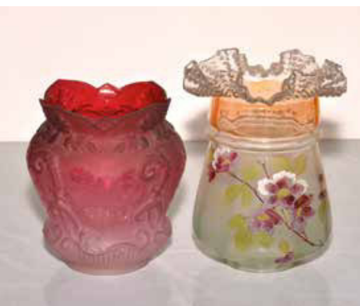
Handgemalte Tulpen für Petroleumlampen