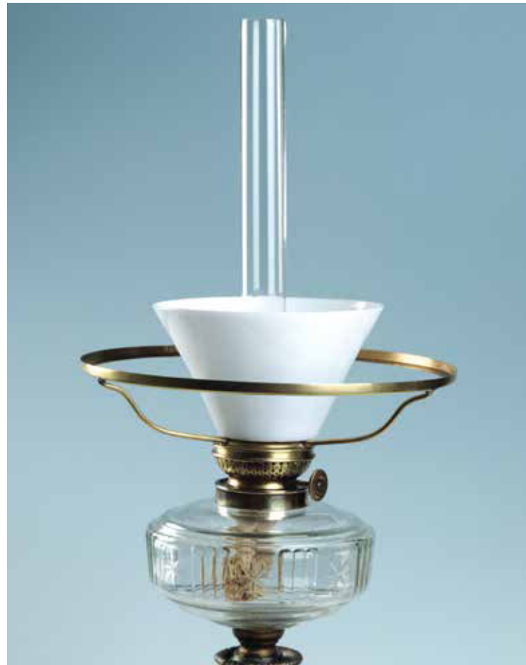
Augenschützer aus Milchglas wie er in den 70er-Jahren des 19. Jhds. empfohlen wurde, um die Augen vor dem ungewohnt hellen Licht der Petroleumlampe zu schützen

Graf Rumford schreibt 1806, dass das Licht einer Argand'schen Lampe die Augen sehr ermüdet und dass man aus der Nähe nicht in die Flamme einer solchen