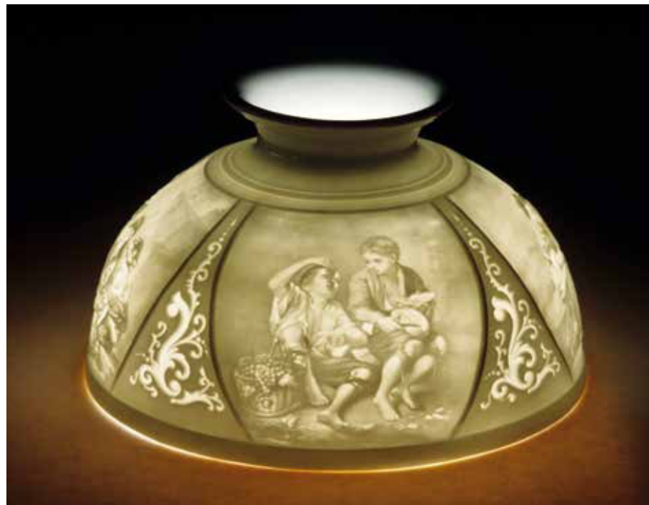
Lithophanieschirm, Petroleumlampenschirm aus Porzellan, bei dem als Folge unterschiedlicher Dicke der Porzellanschicht ein Durchsichtsbild entsteht

Aufgrund damaliger Verhältnisse und je nach Verwendungszweck der Petroleumlampe kann man es nur als äußerst sinnvoll bezeichnen, diese mit einer Vorrichtung versehen zu haben, die das Licht gleichmäßiger verteilt und seine Härte mildert. Ganz abgesehen vom Schutz der Augen wird durch das mildere, diffuse Licht den Schatten ihre Härte und Bedrohlichkeit genommen. Es entsteht ein gemütliches Licht und eine gemütlichere Atmosphäre, was die Menschen sicherlich als sehr angenehm empfunden haben dürften, im Gegensatz zu unserer heutigen Beleuchtung, die doch meist sehr kalt ist, außer bei unseren alten Glühbirnen. Nachdem im frühen 19. Jhd. die Lichtschirme zur Milderung des Kerzenlichtes modern waren, kamen gleichzeitig auch bereits konische, innen weiß gestrichene Blechschirme in Anwendung und seit Argand mattierte Glaskugeln und solche aus Gaze. Diese ganzen Erzeugnisse wurden von den Lampenherstellern in die Petroleumzeit übernommen, weiterentwickelt, verfeinert, verschönert und dem Geschmack der Zeit angepasst.