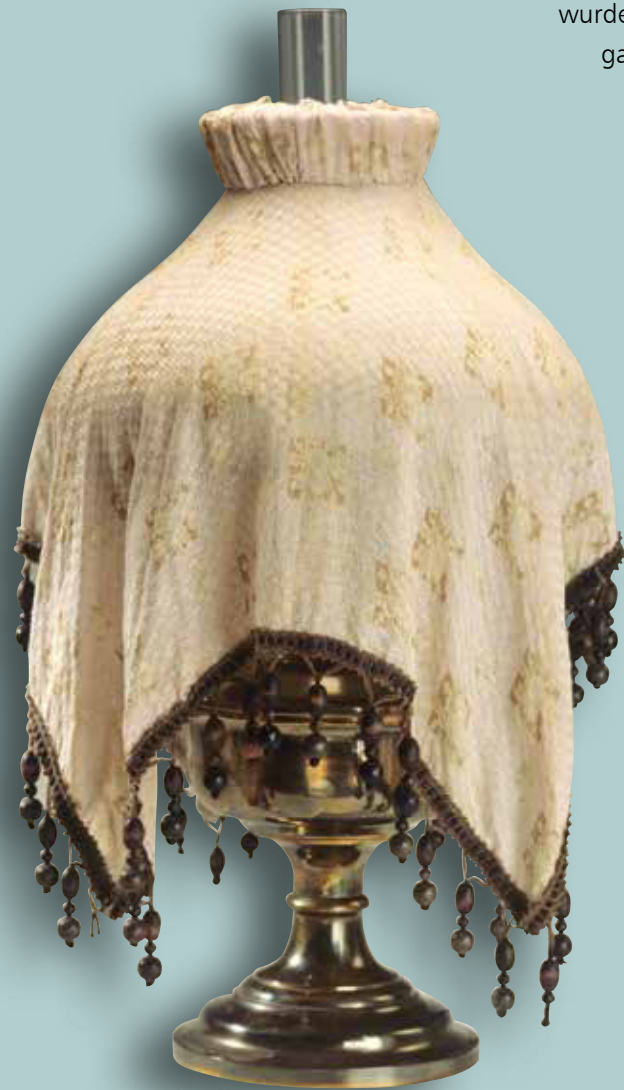
Lichtschleier aus dichtem Stoff, die Schirmkrone mit einbezogen, stärkere Dämpfung des Lichtes, Perlen dienen der Beschwerung

Im Laufe der Jahre, speziell auch mit dem ausgehenden 19. Jhd., änderten sich sowohl die Form der Schirme als auch die Materialien, aus denen die Lampenschirme gefertigt wurden. Bei den Vesta-Schirmen wurde der obere Rand gefältelt und gleichzeitig auch noch geschwungen, was dem Schirm eine barocke Form gab, seine Plumpheit jedoch etwas abmilderte und ihm den Namen Röckchen-Schirm eintrug. Dabei änderte sich auch oft die Gesamtkörperform des Schirmes, was dem Schirm sehr wohl tat. Die Anfang der 90er-Jahre des 19. Jhds. in Mode gekommenen Stoffschirme, gefältelt und gerüschelt, aus Seide, Spitze und Gaze, mit und ohne Fransen, haben sich bis weit in die Zeit des Art Deco gehalten, wurden dabei aber begreiflicherweise einfacher und strenger. In der Anfangszeit wurden sie in teilweise bizarren Formen auf grö-