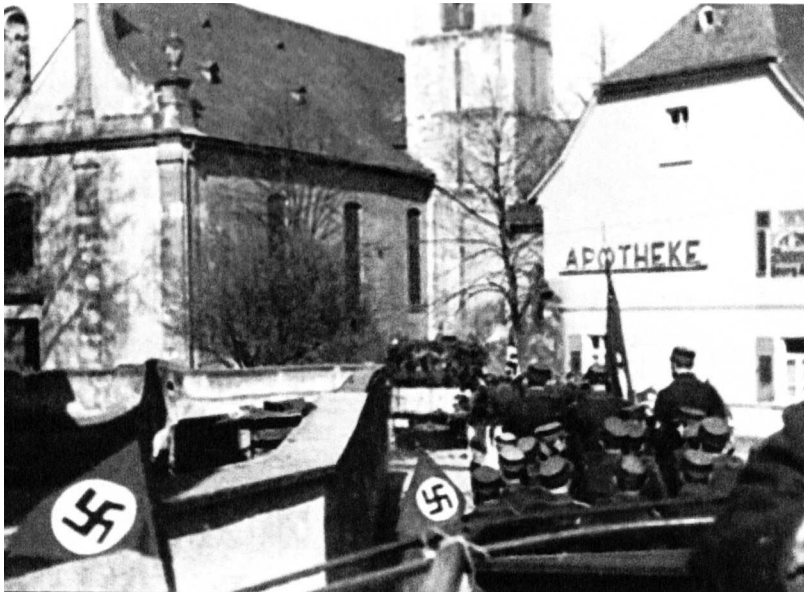
Die SA (Sturmabteilung) in Nieder-Olm 1935

2,1. Ab 1930/31 erhielt die NSDAP im Reich und in Hessen die meisten Stimmen, nicht so in katholisch geprägten Regionen. In Nieder-Olm startete die NSDAP 1928 mit 0,3 Prozent (3 Personen), bei der Landtagswahl 1931 wählten 244 Personen (18,9 Prozent) die NSDAP und bei den noch einigermaßen freien Reichstagswahlen vom 5. März 1933 nur 383 Personen (28,2 Prozent). In ganz Hessen waren es 50,3 Prozent und in Stadeldeken 90,7. Die Anfänge des Nationalsozialismus in Rheinhessen in den 1920er Jahren hat kürzlich Markus Würz im Detail untersucht. Hitlers Konzept war bekannt, jeder konnte es in seinem Buch „Mein Kampf“ nachlesen. Viele lasen es überhaupt nicht, und diejenigen, die das Buch kannten, nahmen es nicht ernst.