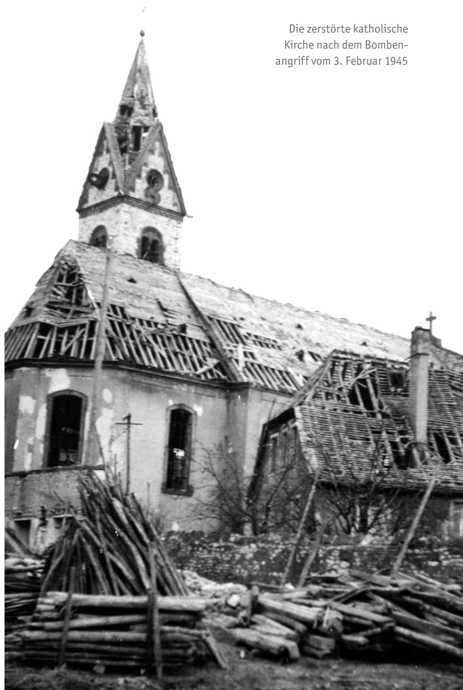
Die zerstörte katholische Kirche nach dem Bombenangriff vom 3. Februar 1945