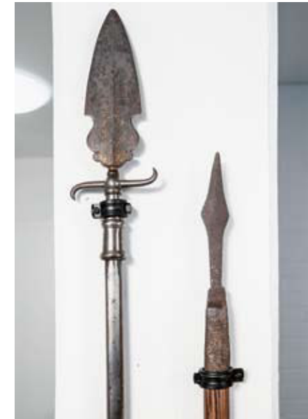
Spieß Eisen, Holz 17. Jahrhundert

Der Spieß oder die Pike – im Volksmund auch Saufeder genannt – gehörte zu den einfachen Stangenwaffen und wurde überwiegend von den ärmeren Bevölkerungsschichten zu Jagd- und Kriegszwecken eingesetzt. Die zu den Langspießen zählenden Waffen hatten nicht selten bis zu 5 Meter lange Schäfte.