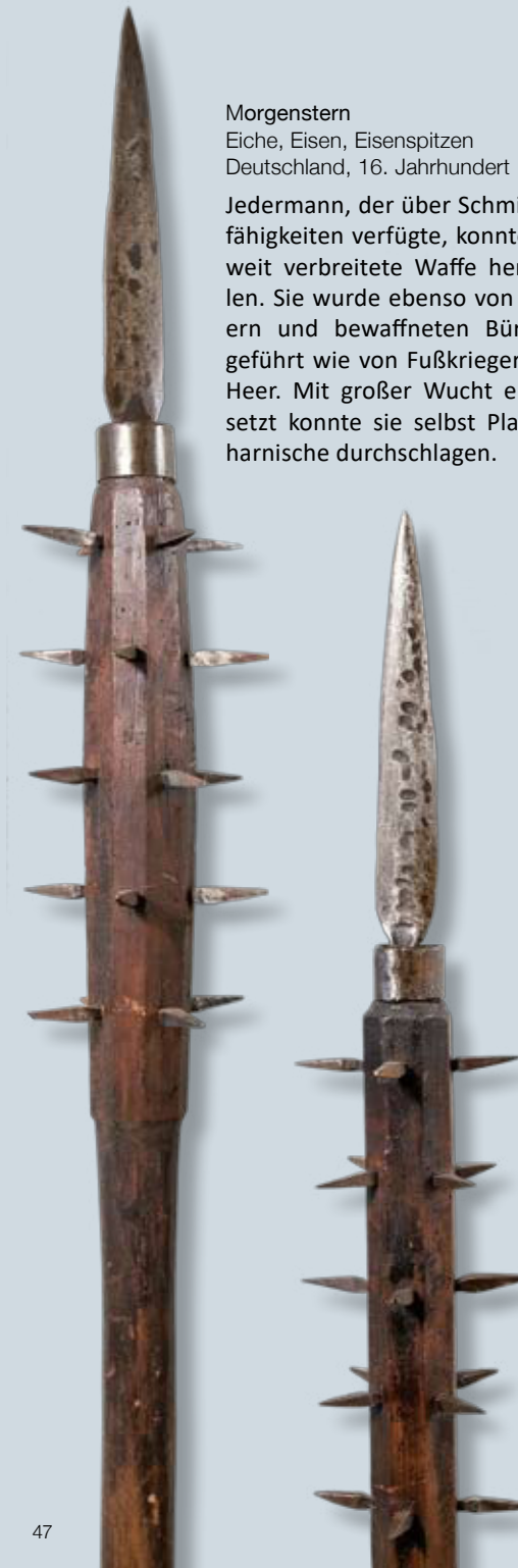
Morgenstern Eiche, Eisen, Eisenspitzen Deutschland, 16. Jahrhundert

Die Stiche entstammen Bilderfolgen, die minutiös die einzelnen Schritte bei der Handhabung der Waffen darstellen. Sie dienten als Anleitung für die Soldaten des 17. Jahrhunderts im Umgang mit der schweren Feuerwaffe Muskete, dem leichten Handrohr und der Pike.