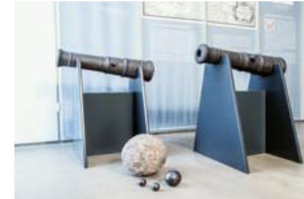
Kartaune Aus der Ratinger Stadtbefestigung, Eisen, 16./17. Jahrhundert

Jedermann, der über Schmiedefähigkeiten verfügte, konnte die weit verbreitete Waffe herstellen. Sie wurde ebenso von Bauern und bewaffneten Bürgern geführt wie von Fußkriegerern im Heer. Mit großer Wucht eingesetzt konnte sie selbst Plattenharnische durchschlagen.