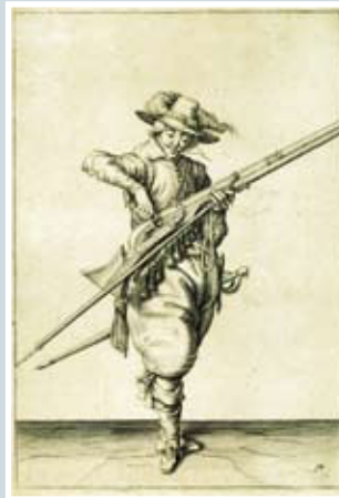
Jaques de Gheyn II. (1565–1629) Waffenhandlung. Von den Rohren, Musqueten und Spiessen etc. , Blatt 4 und 17, Kupferstich, Den Haag 1607

Die Stiche entstammen Bilderfolgen, die minutiös die einzelnen Schritte bei der Handhabung der Waffen darstellen. Sie dienten als Anleitung für die Soldaten des 17. Jahrhunderts im Umgang mit der schweren Feuerwaffe Muskete, dem leichten Handrohr und der Pike.