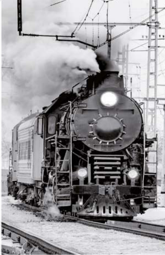
Bahnhof Ratingen-Ost, um 1908

Das Bahnhofsgebäude an der Oststraße war um das Jahr 1900 fertiggestellt und steht heute unter Denkmalschutz. Der Westbahnhof wurde im Zweiten Weltkrieg zerstört, das provisorische Ersatzgebäude 1978 niedergelegt.