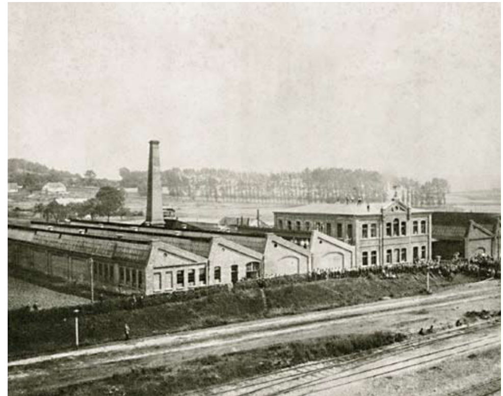
Röhrenkessel-Fabrik Dürr mit Belegschaft Fotografie um 1890