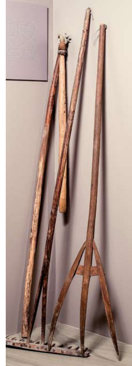
Dreschflegel, Rechen, Mistgabel Holz, 19. Jahrhundert

Die Tiere waren wichtige Fleisch-, Leder- und Schmalzlieferanten. Ihnen und ihrem Hirten zu Ehren war nicht nur ein Turm der Stadtbefestigung als Verkeshirtenturm benannt. Der Sage nach sollen Schweine auch die Märch , die Hauptglocke der Pfarrkirche, wiedergefunden haben, nachdem sie in Kriegszeit zur Rettung vor dem Einschmelzen an einem geheimen Ort im Wald vergraben worden war.