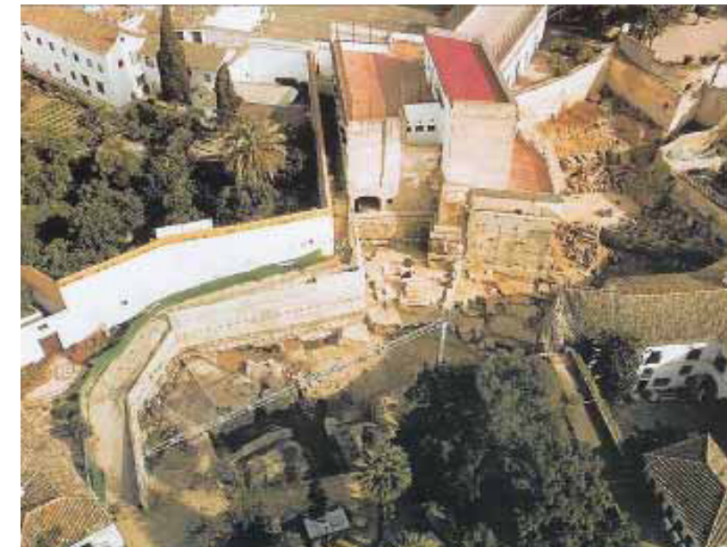
Abb. 1: Die administrative Gliederung Hispaniens in der frühen Kaiserzeit

Der Befund übertrifft nach drei Jahrzehnten alle Erwartungen: Neben spektakulären Befunden wie dem Theater von Corduba (Córdoba) (Abb. 2), dem Forum von Carthago Nova (Cartagena) oder dem Hafen von Caesaraugusta (Zaragoza), Teilen der