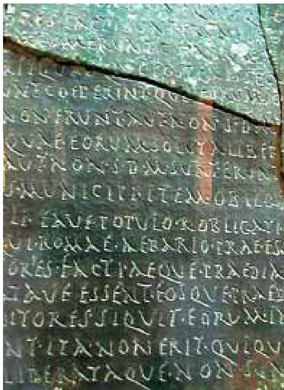
Abb. 2: Das Theater von Corduba, das sich unter dem Museo Arqueológico der Stadt verbarg

war. Nun hat die Einbeziehung weiterer Stadttypen – nach den Provinzhauptstädten wandte man sich auch den conventus -Hauptorten, Munizipien und oppida zu – gezeigt, dass sie erst unter den Flaviern einen Ausbau erfuhren, und zwar in Folge der Verleihung des latinischen Rechtsstatus an ganz Hispanien durch Vespasian (Plinius, Naturgeschichte 3,30). Insofern kann man also durchaus von einer weiteren „formativen Periode“ sprechen, in der Rom zudem durch Stadtgesetzgebung, aber auch durch Gesetze, die den provinziellen Kaiserkult thematisierten, für bereits bestehende Praktiken eine Norm zu etablieren suchte. Auch gilt es inzwischen als erwiesen, dass das 3., traditionell als ‚krisenhaft‘ bezeichnete Jahrhundert, in dem – ausgelöst durch Einfälle von Franken und Alemannen in den 60er- und 70er-Jahren – die blühende Stadtkultur des 1. und 2. Jhs. vollkommen und unwiederbringlich zerstört worden sei, entsprechende Symptome nicht aufweist. Es war offensichtlich nicht durch Katastrophen, Zerstörung und Ruin geprägt; in Bezug zum Beispiel auf das Straßennetz oder Dedikationen von Seiten der Städte und Amtsinhaber an die Kaiser lässt sich vielmehr Kontinuität konstatieren. Auch der Drang von Angehörigen der sozialen Eliten zur Selbstdarstellung blieb ungebrochen, selbst wenn ein in den beiden Jahrhunderten zuvor nicht bekannter Lebensstil zu einer stärkeren Konzentration auf den ‚privaten‘ Raum führte. Die Zugehörigkeitsstrukturen