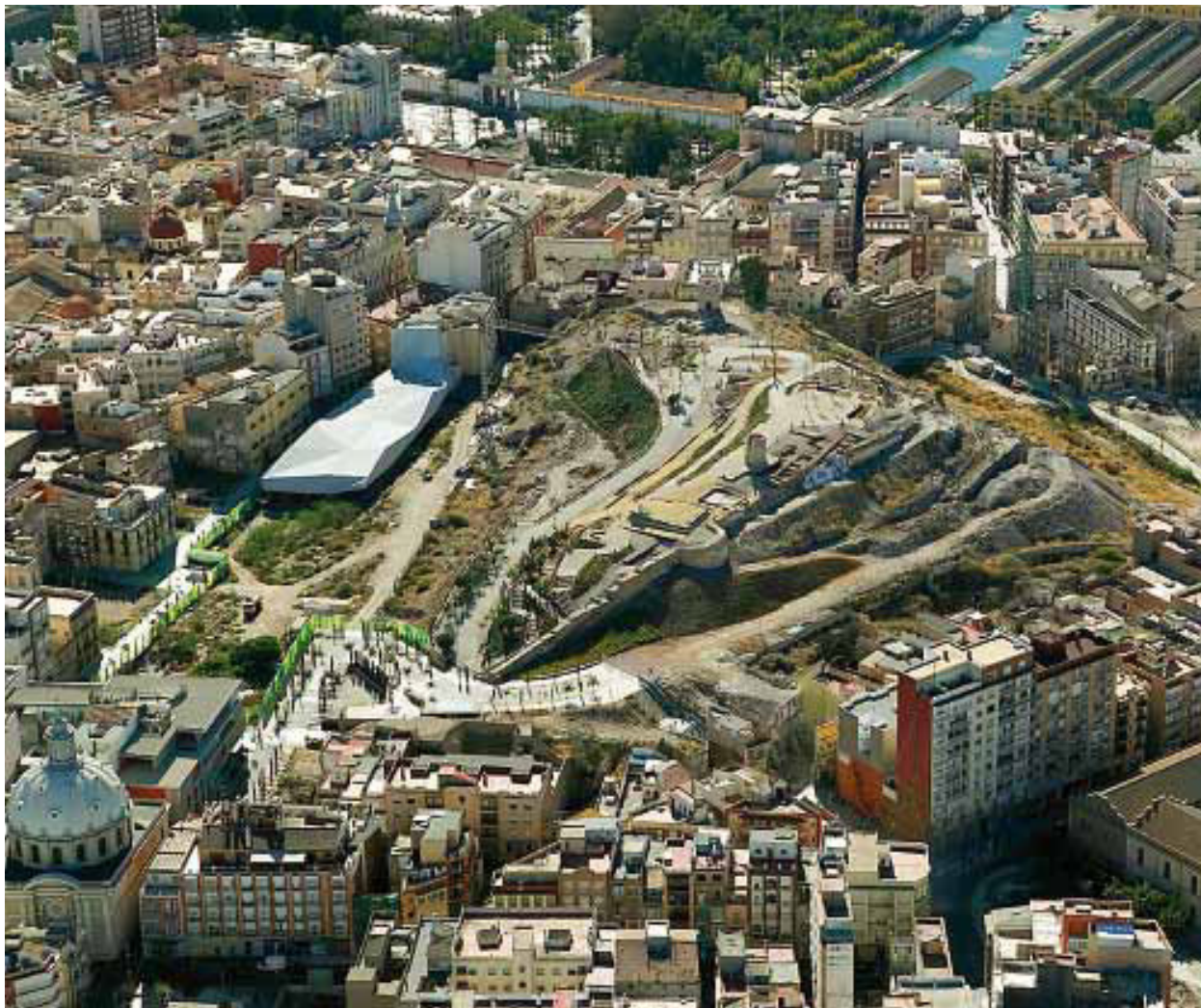
Abb. 2: Das Theater von Corduba, das sich unter dem Museo Arqueológico der Stadt verbarg

bäische Olivenöl gelangte zwecks Versorgung der Legionen zudem an den Limes und kann insofern als wahrer ‚Exportschlager‘ bezeichnet werden. Generell zeichnete sich das Wirtschaftsleben Hispaniens – so Felix Teichner – durch eine auf den Export von Gütern ausgerichtete Produktion aus: Neben „Metallen aller Art“ und Olivenöl vertrieben die Hispani Wein und Fischsaucen, für die begehrten Purpurwaren hatten sie sogar das Monopol inne. Derartige Handelsaktivitäten sorgten nicht nur für Umschlag in den urbanen