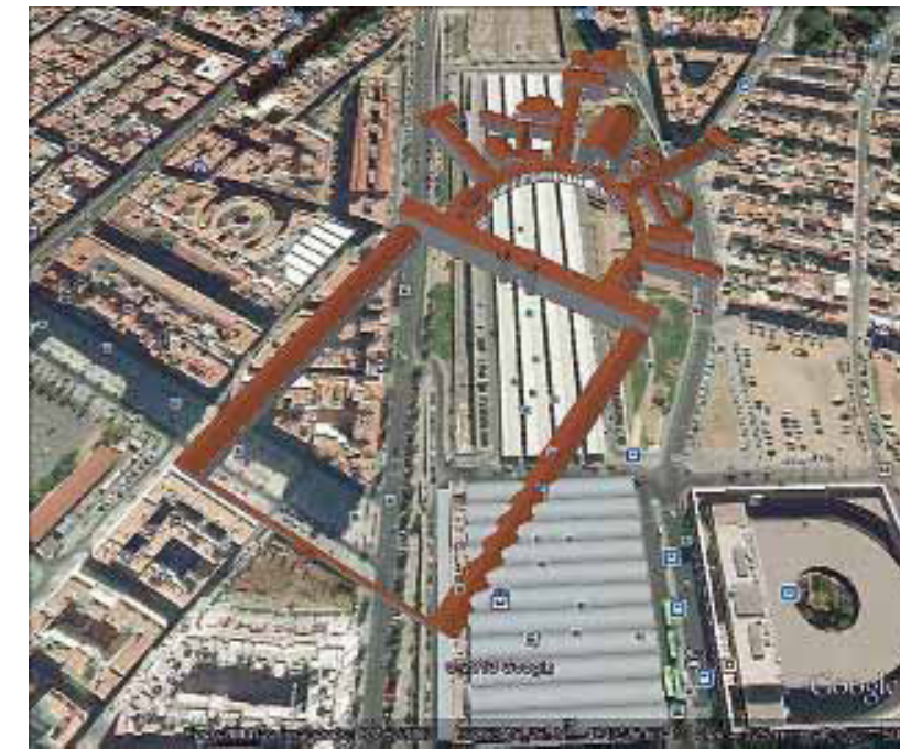
Abb. 2: Das Theater von Corduba, das sich unter dem Museo Arqueológico der Stadt verbarg