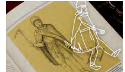
In Skandinavien einen Mantel über einem kurzen Gewand.