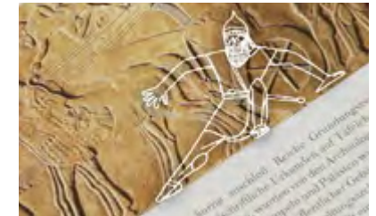
Und auch in Assyrien einen Rock.