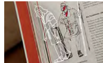
Im römischen Reich kämpften die Legionäre noch vor 2000 Jahren in Tunika über nackten Beinen.