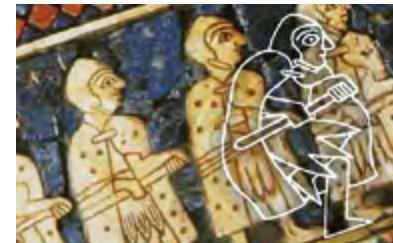
Im Königreich Sumer einen Umhang und darunter einen kurzen Rock.