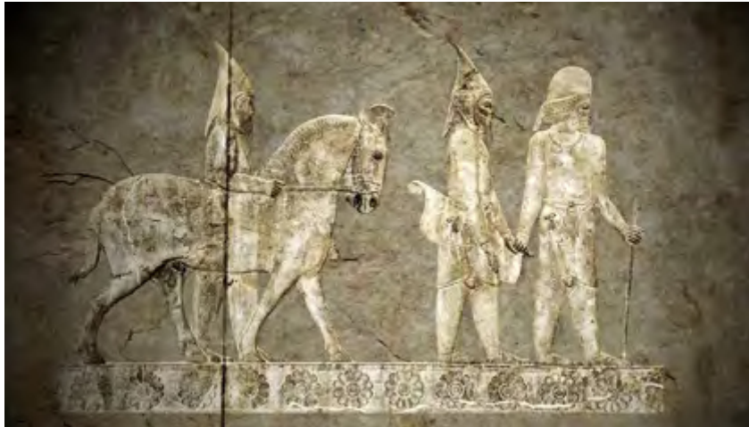
Persepolis, Apadana-Palast, D-Dat-EUR-TEH 1964-0264