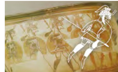
In Griechenland einen Fransenrock.