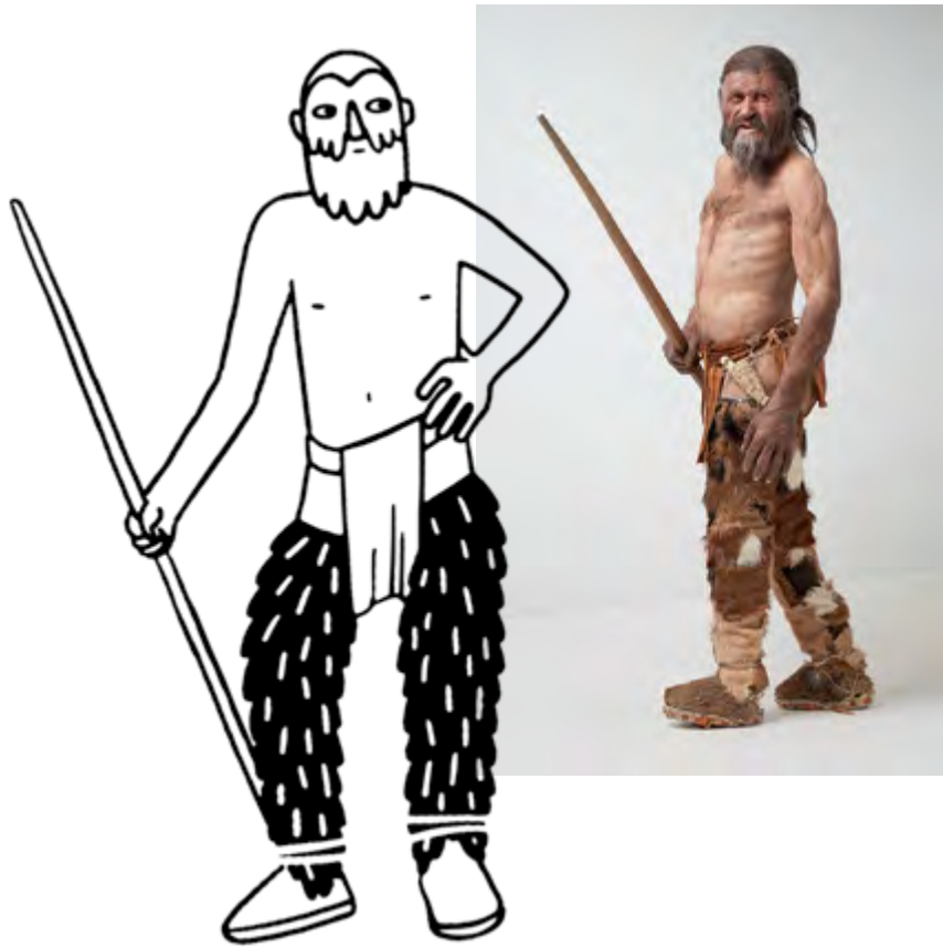
Reconstruction by Kernis © South Tyrol Museum of Archaeology, Augustin OchseneiterHR