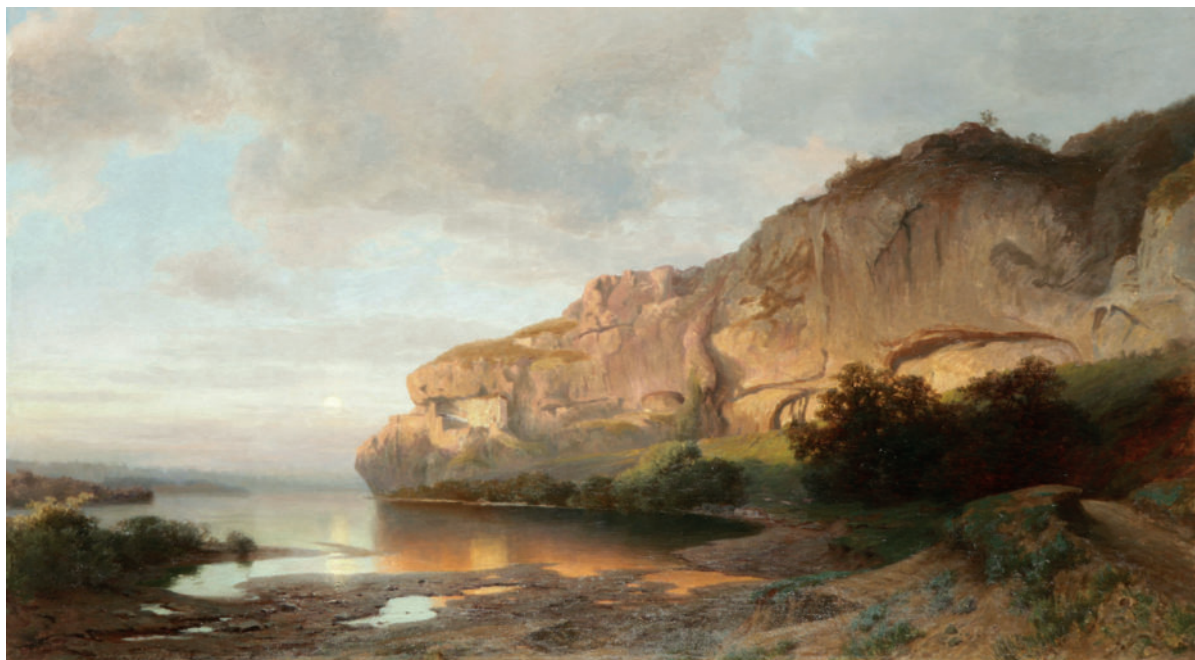
Ce grand tableau à l'huile (90 x 160 cm) exécuté par Eduard Tenner en 1882 montre le Rhin avant sa correction au niveau de la falaise d'Istein dans le Markgräflerland. Les espaces représentés en eau sont aujourd'hui occupés par des prairies sèches et par l'autoroute Bâle-Karlsruhe. DLM BKVer 25.