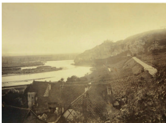
Photo du village de pêcheurs d'Istein en 1868. Le Rhin n'est pas encore rectifié à cet endroit. La ligne de chemin de fer doit donc passer plus haut et traverser la falaise. Depuis la correction, le village ne se trouve plus au bord du fleuve. DLM Fo 1582.