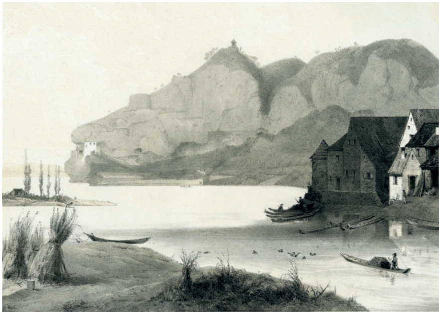
Le village d'Istein avec les maisons des pêcheurs et leurs barques avant la correction du fleuve. Lithographie de Friedrich Kaiser de 1849. DLM BKKa 14.

Aujourd'hui, seule une infime partie des prairies du Rhin supérieur est restée intacte. De part et d'autre des frontières, on tente de restaurer la biodiversité avec des barrages équipés d'échelles à poissons et des aménagements de zones d'inondation.