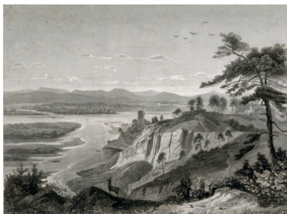
Vue depuis le Kaiserstuhl avec le château de Sponeck sur le Rhin sinueux s'étalant sur 3 kilomètres ; à l'arrière-plan, les Vosges. Gravure à l'eau forte de J. Riegel sur un modèle de R. Höfle, vers 1850. DLM GrLS 32.