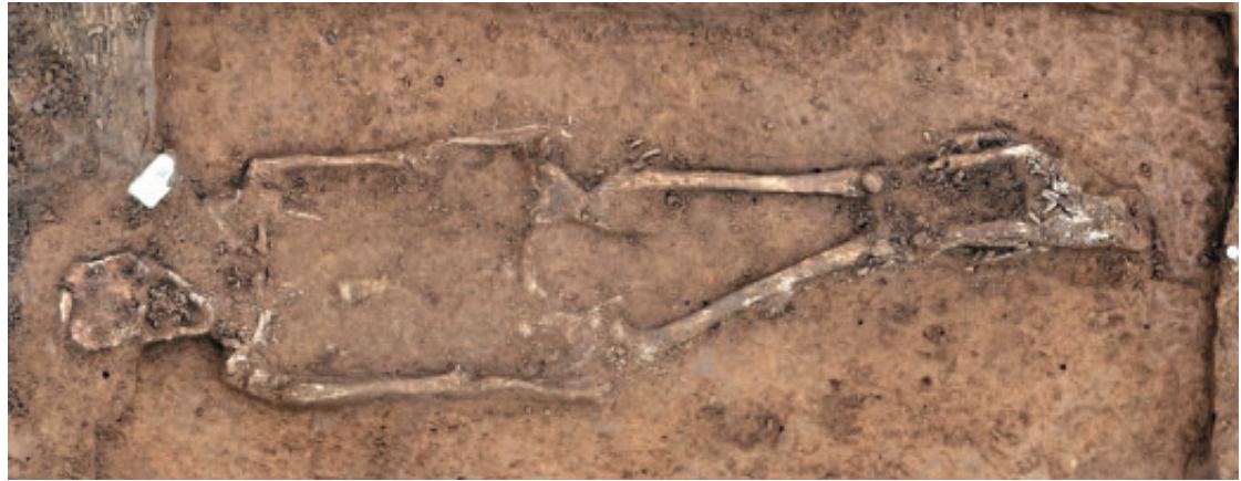
2 Euskirchen-Kuchenheim. Körperbestattung im Planum 2 mit Blick gegen Osten.

den Arbeitsbereichen 91 und 144. Die erfassten Ausschnitte deuten auf eine offene Siedlung hin, deren Ausdehnung auf 3,5 ha geschätzt wird. Die Siedlungsgrenze zeichnet sich im Süden und Osten gut ab, während die Befunde im Westen sicher bis an die aktuelle Bebauung reichen. Im Nordwesten bleibt die Befundsituation unklar, größere Störungen des Bodenaufbaus stammen wohl aus der Zeit des Zweiten Weltkrieges.