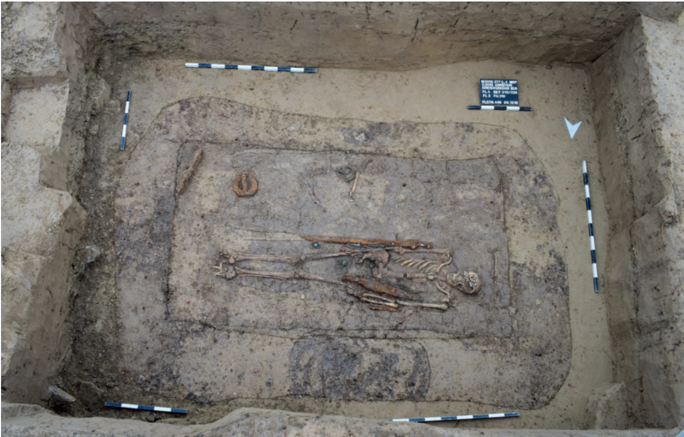
Abb. 4: Bereits 1817 und 1910 wurden erste Grabfunde westlich von Arnstein entdeckt. 2018 mussten 19 Gräber dieses Gräberfelds einer Bundesstraße weichen. In einem Kammergrab (Bef. 310) wurde ein junger Mann in Tracht und mit kompletter Waffenausstattung bestattet: Spatha, Sax, Lanze und Schild.

und Magisterarbeiten geleistet. Daneben erschienen zahlreiche Artikel zu aktuellen Untersuchungen im und um den Zentralort.